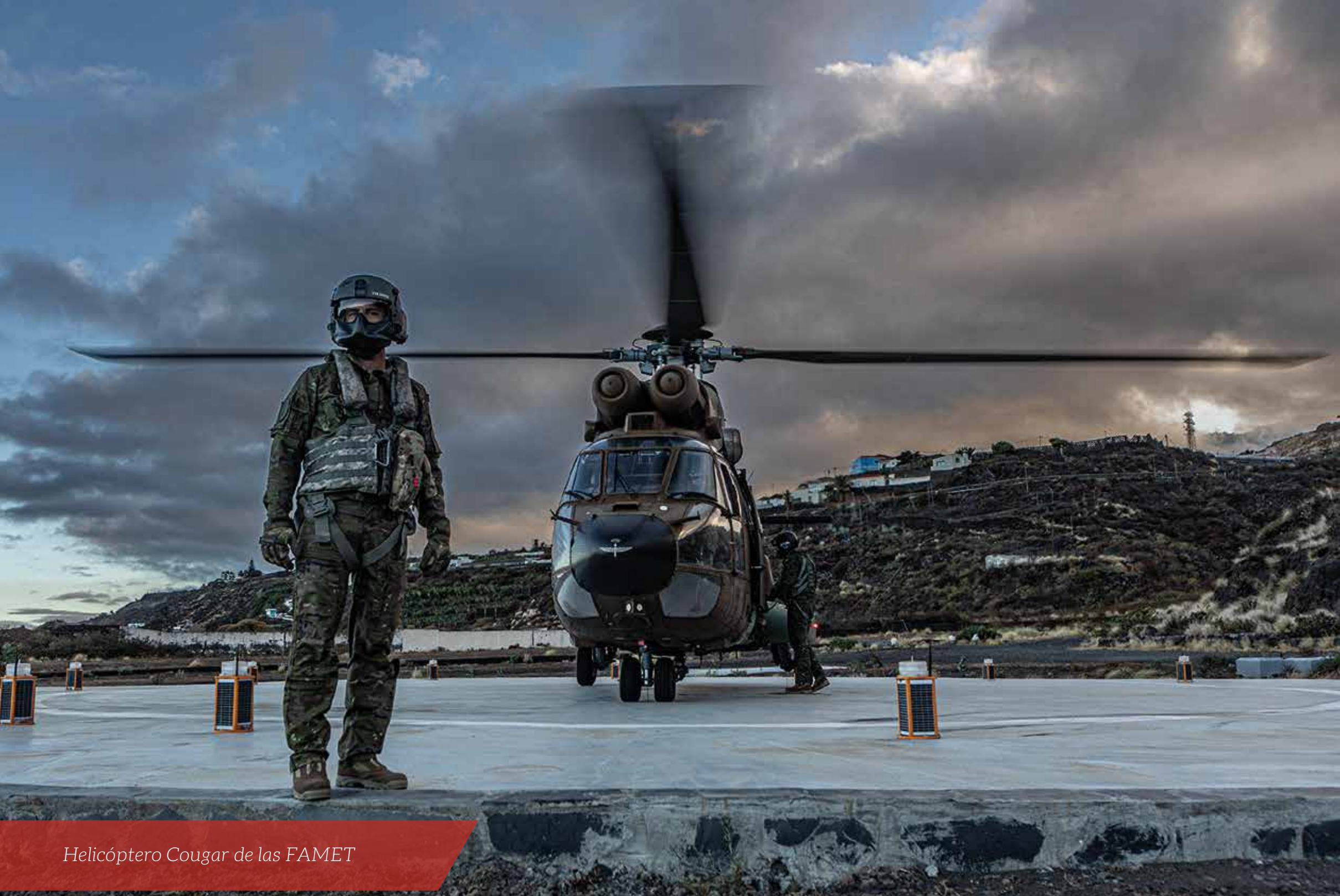
Helicóptero Cougar de las FAMET