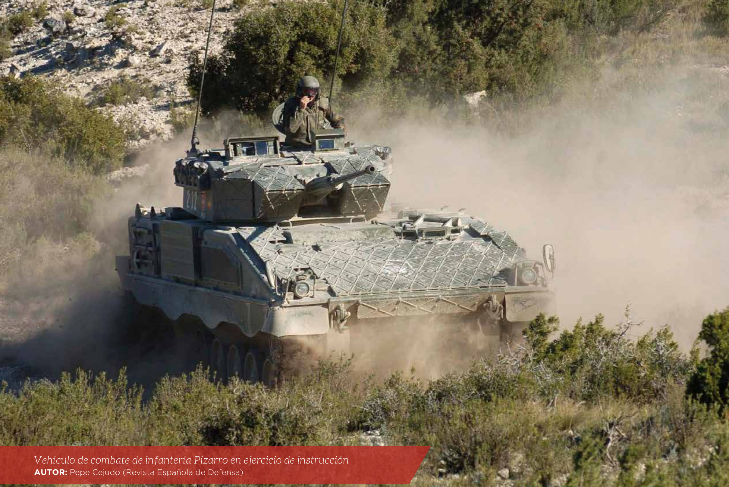
Vehículo de combate de infantería Pizarro en ejercicio de instrucción