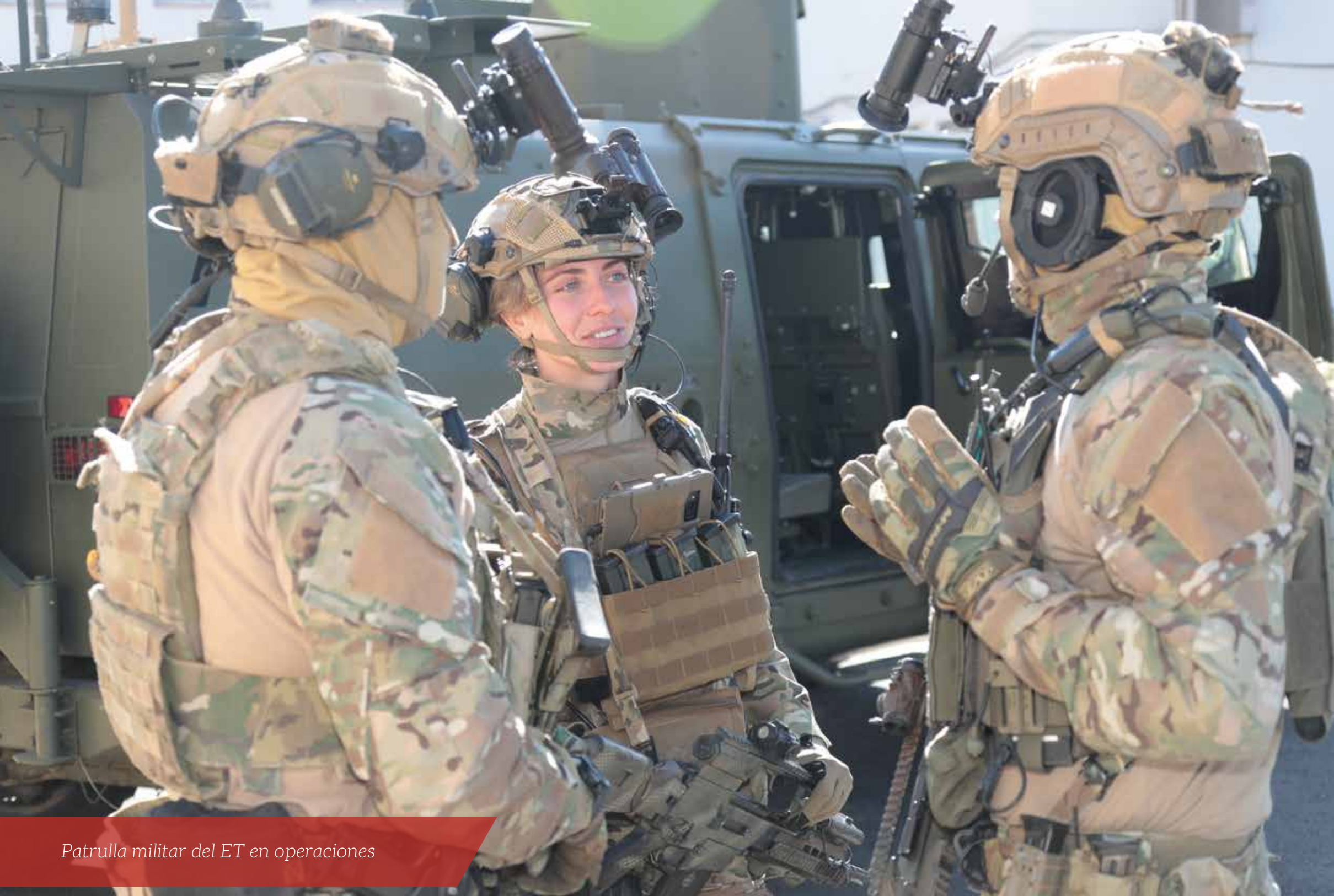
Patrulla militar del ET en operaciones