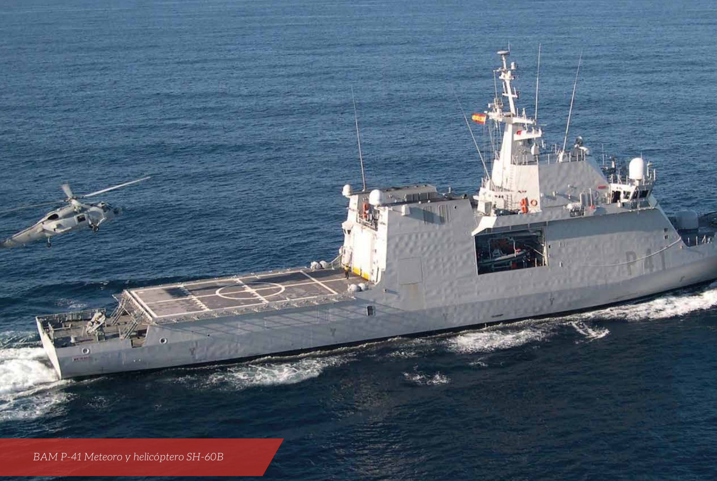
BAM P-41 Meteoro y helicóptero SH-60B