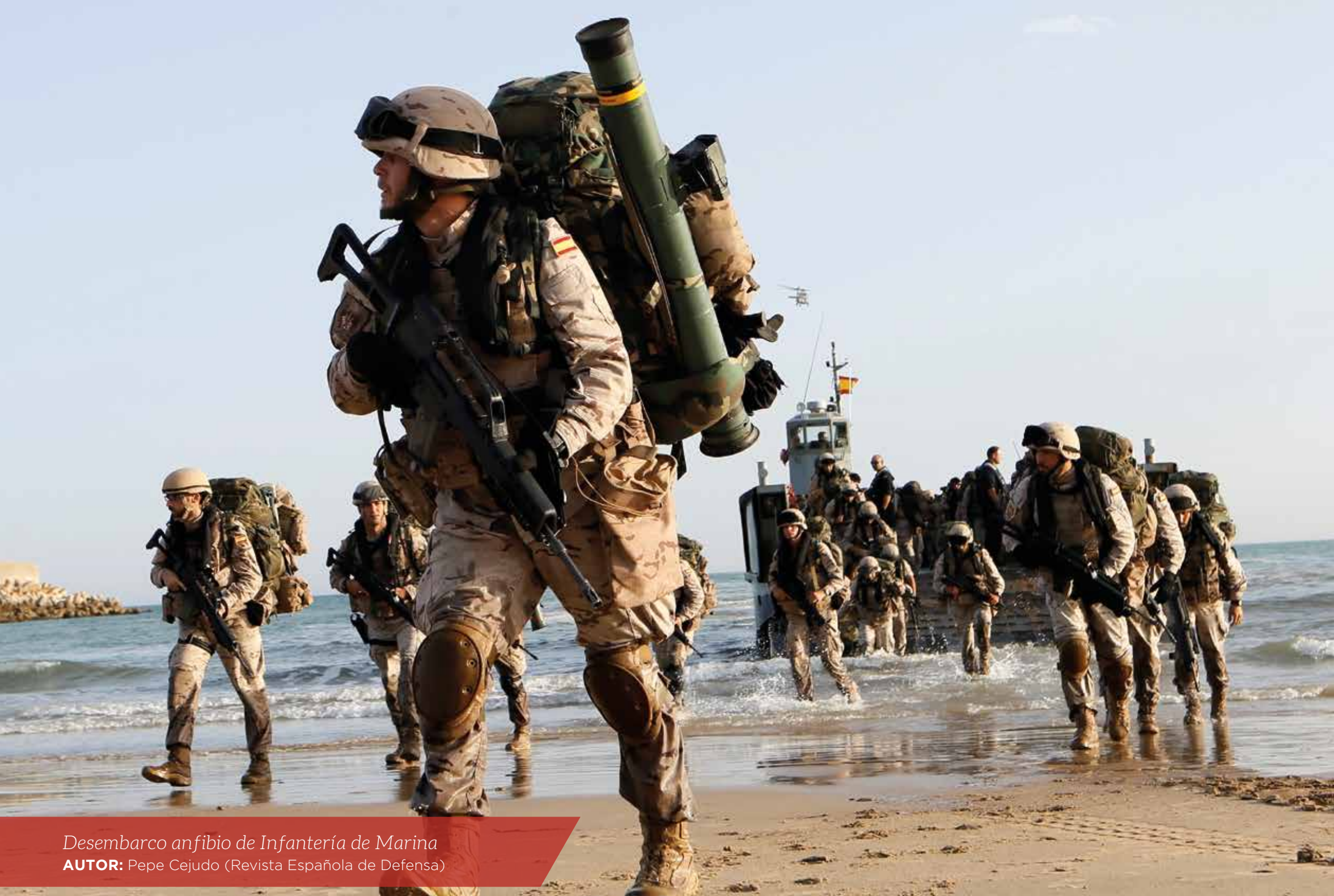
Desembarco anfibio de Infantería de Marina