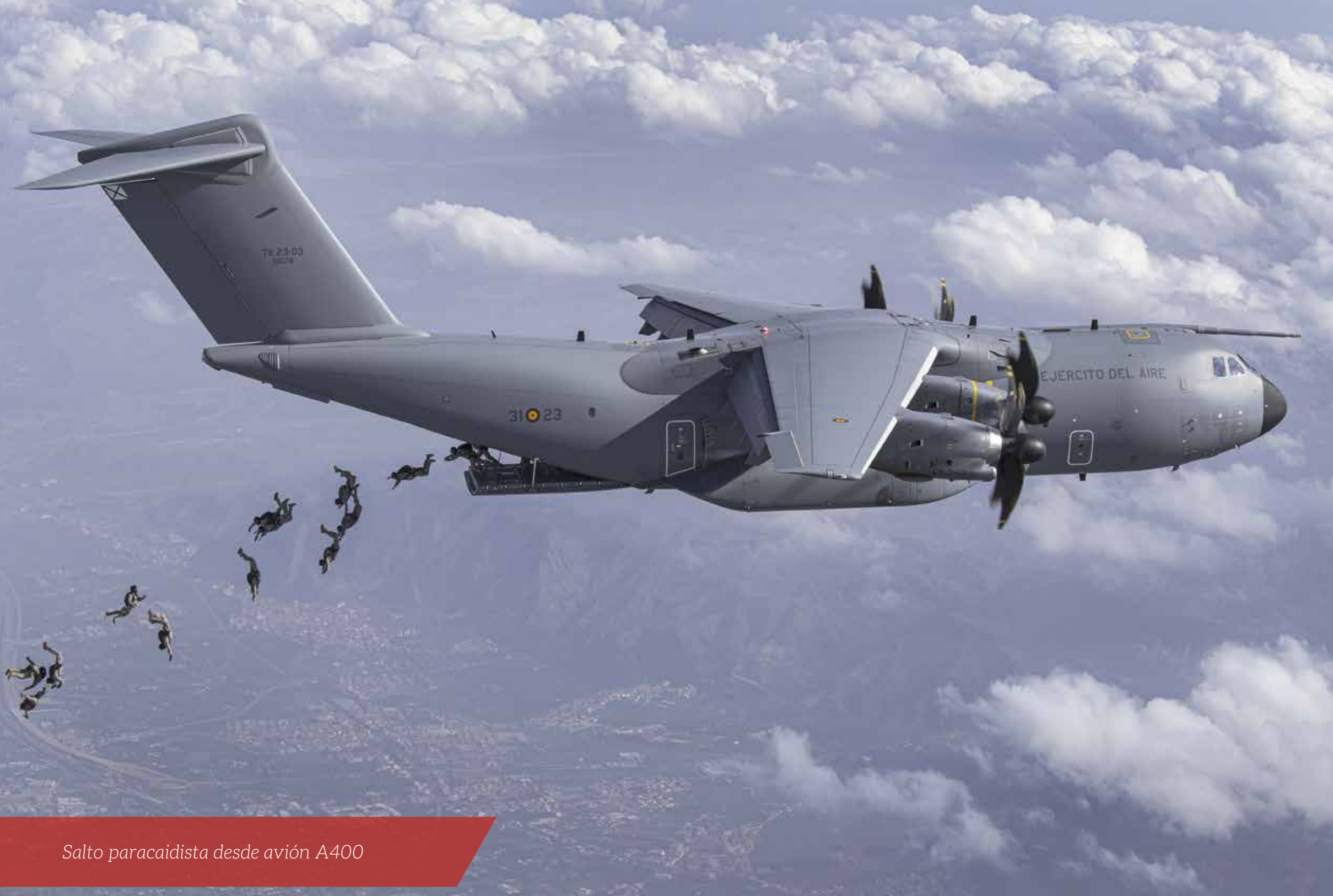
Salto paracaidista desde avión A400