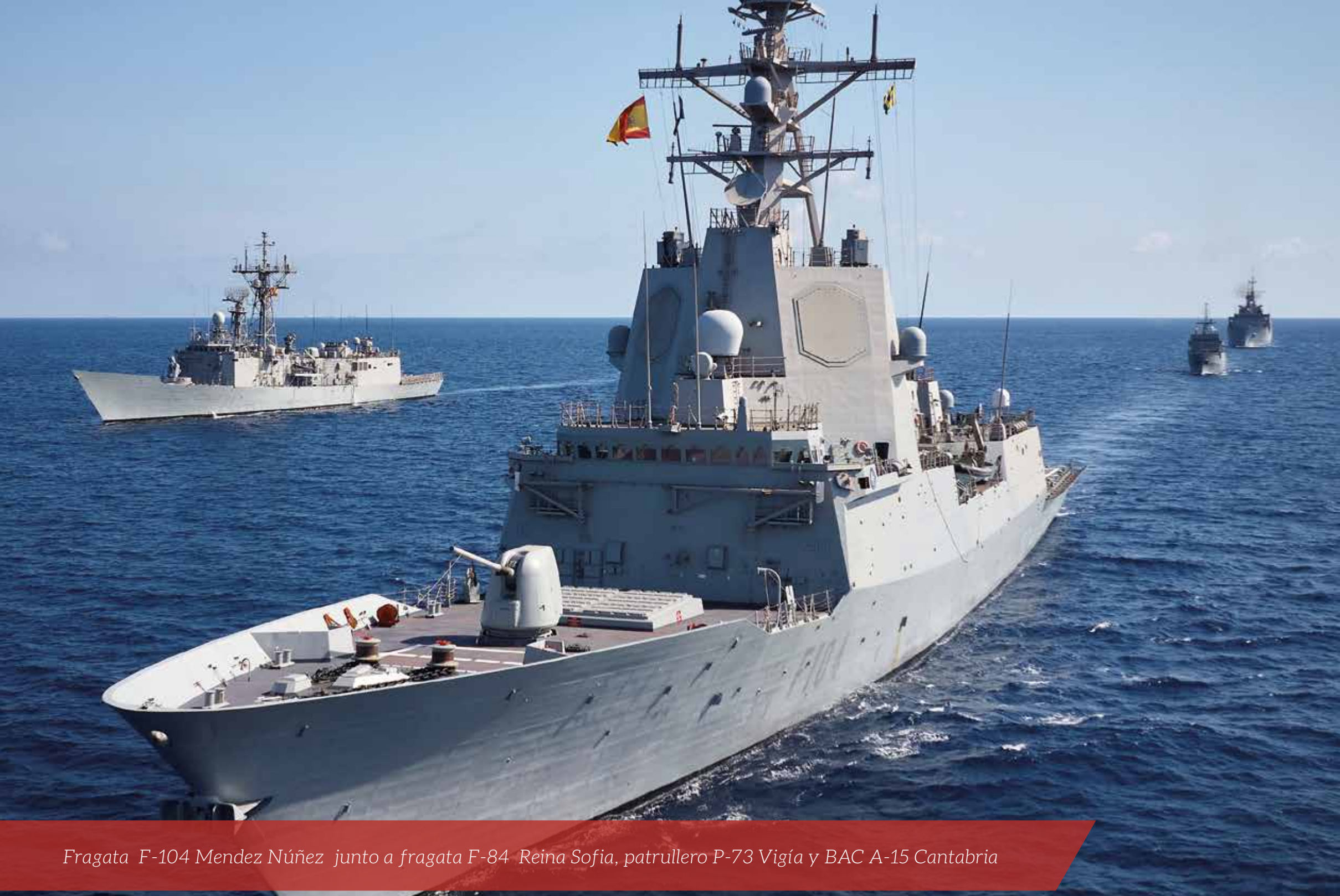
Fragata F-104 Mendez Núñez junto a fragata F-84 Reina Sofía, patrullero P-73 Vigía y BAC A-15 Cantabria