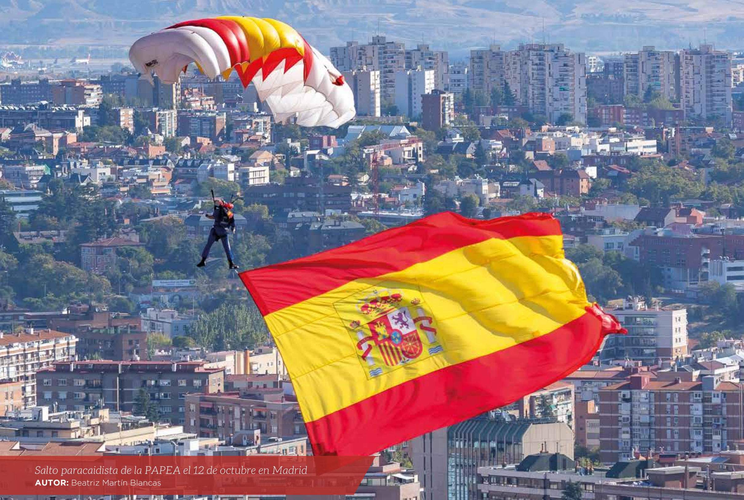
Salto paracaidista de la PAPEA el 12 de octubre en Madrid