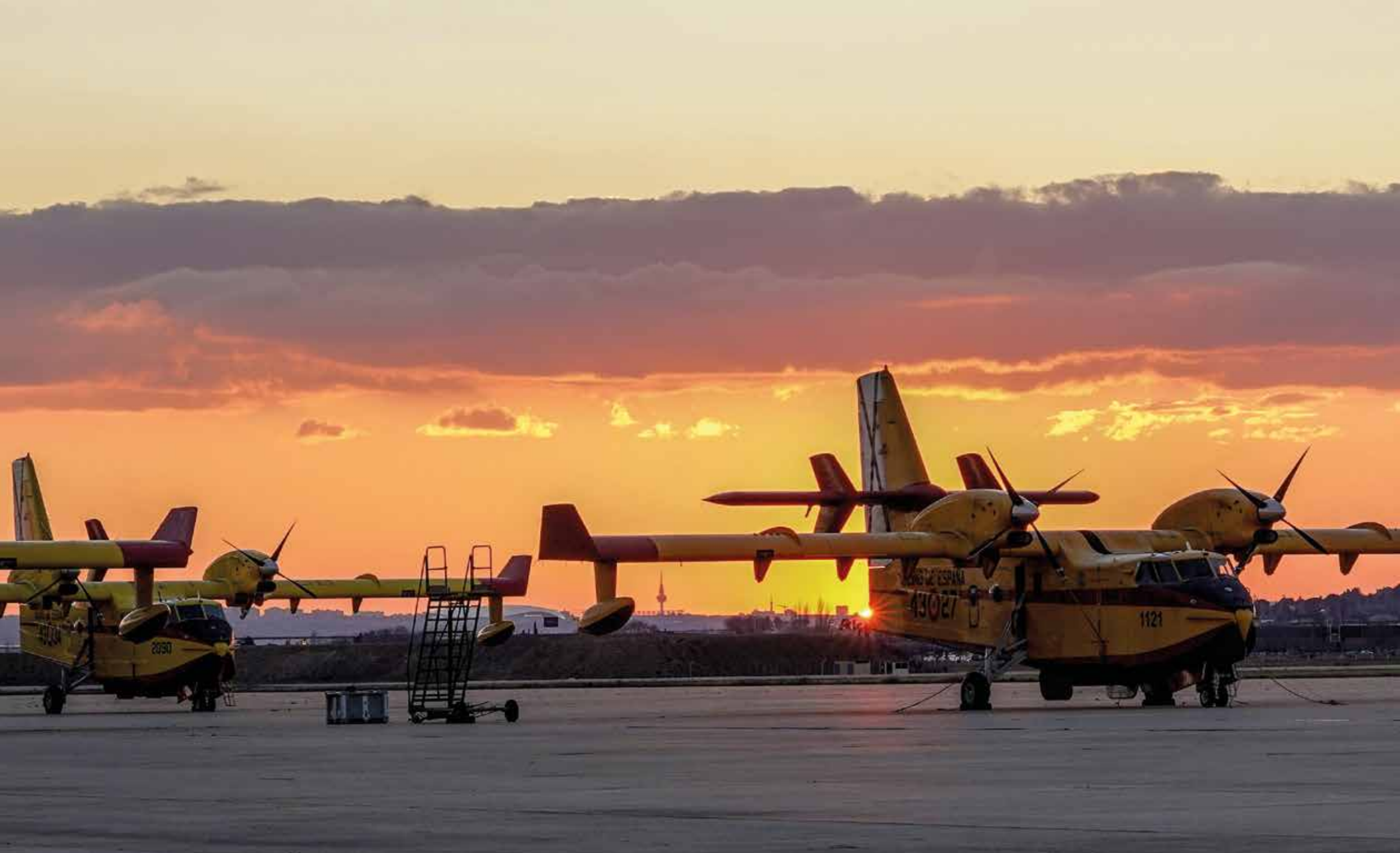
Aviones apagafuegos Canadair en la B.A. de Torrejón