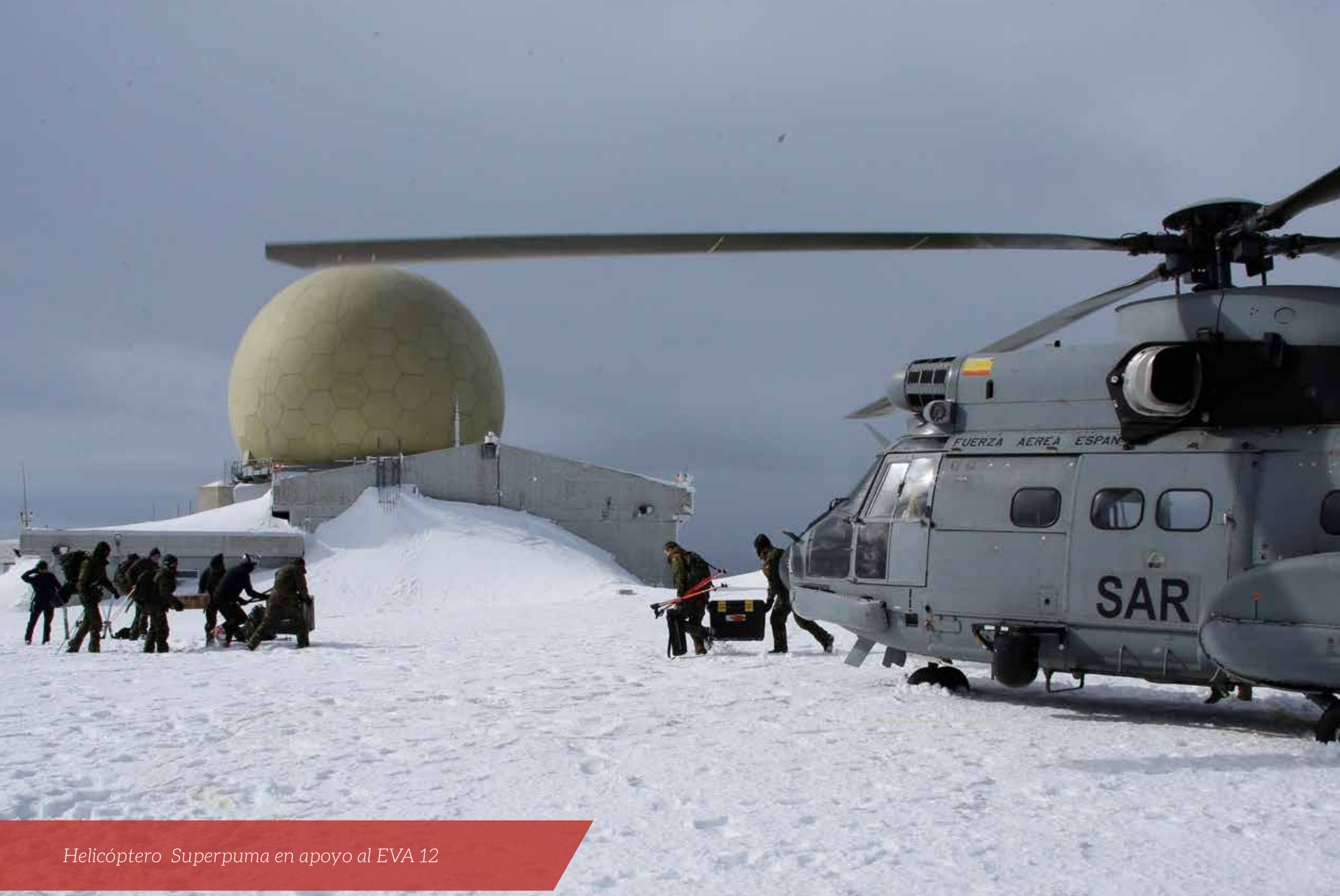
Helicóptero Superpuma en apoyo al EVA 12