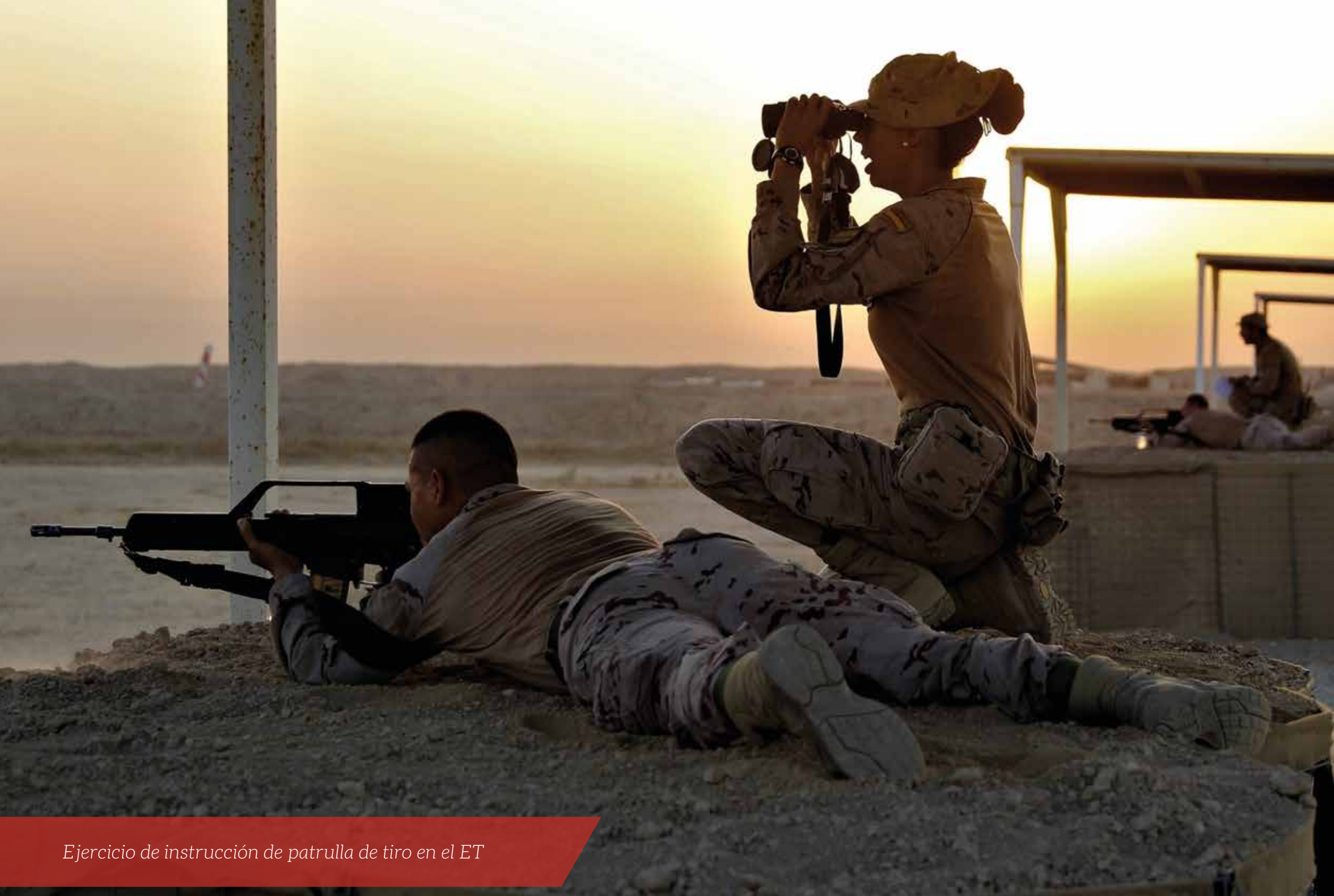
Ejercicio de instrucción de patrulla de tiro en el ET