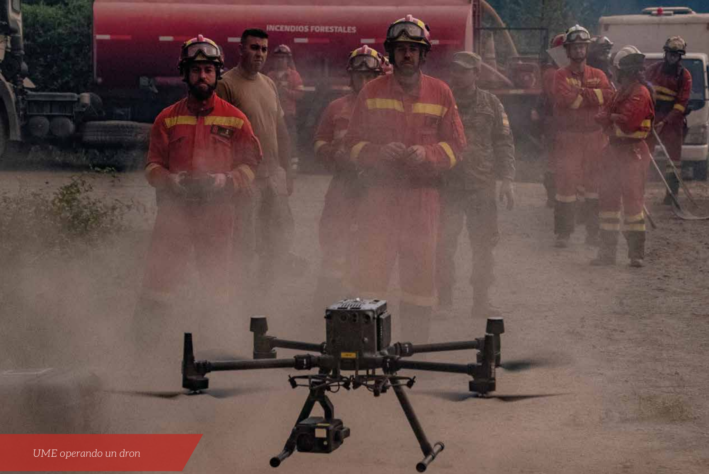
UME operando un dron