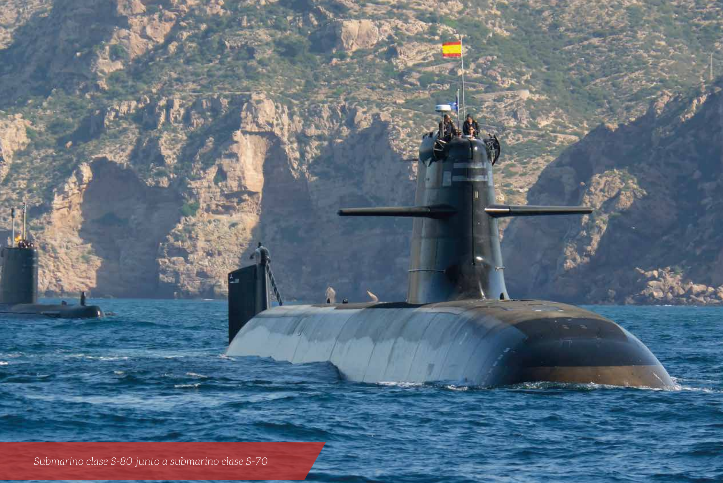
Submarino clase S-80 junto a submarino clase S-70